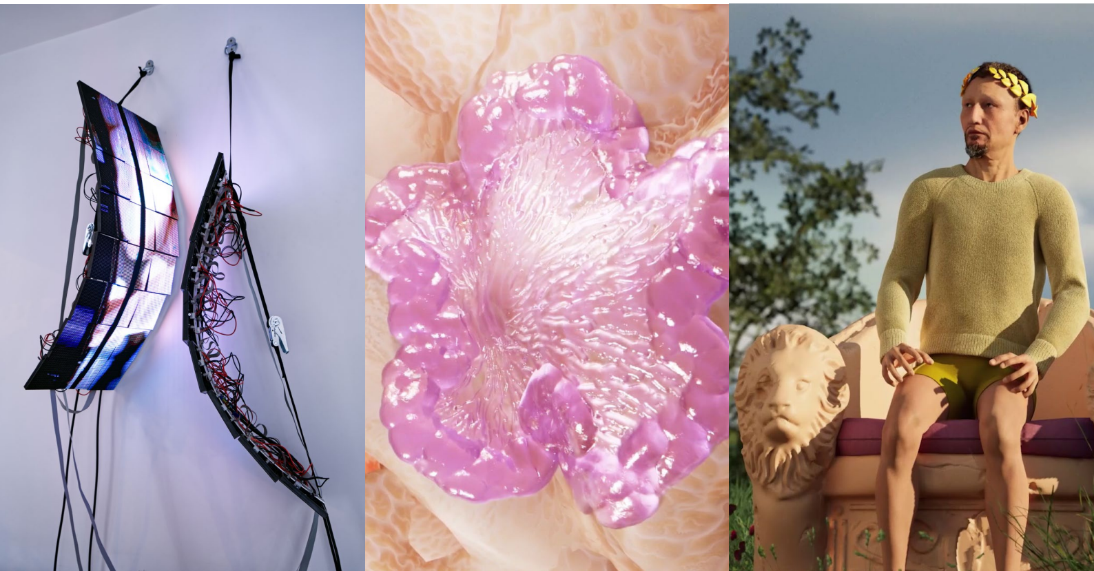
De gauche à droite : Lukas Truniger , An Automated Self , 2023, avec l'aimable autorisation de l'artiste ; Isabell Bullerschen , ipseria (cave of intelligent slime) , 2022, avec l'aimable autorisation de l'artiste ; Rhona Mühlebach , Ditch Me , 2023, avec l'aimable autorisation de l'artiste.