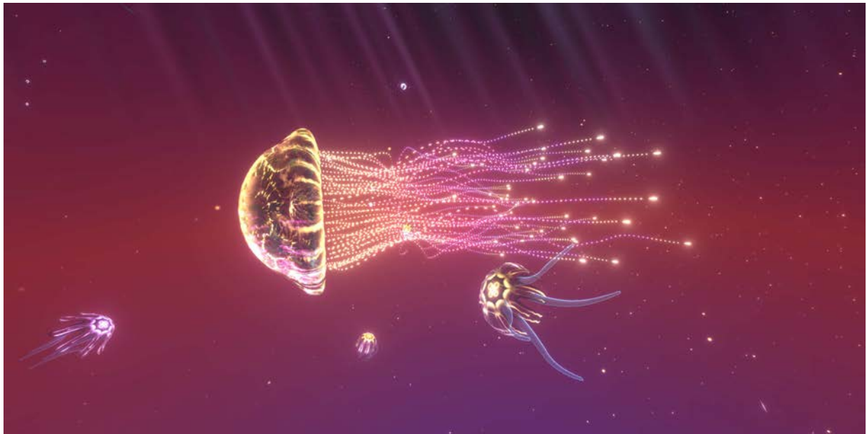
Mélodie Mousset, Edo Fouilloux, The Jellyfish , 2020. Screen-Shot aus VR.

Sonderöffnungszeiten während der Kunsttage Basel: Sa/So, 03./04.09., 10:00-18:00 Uhr